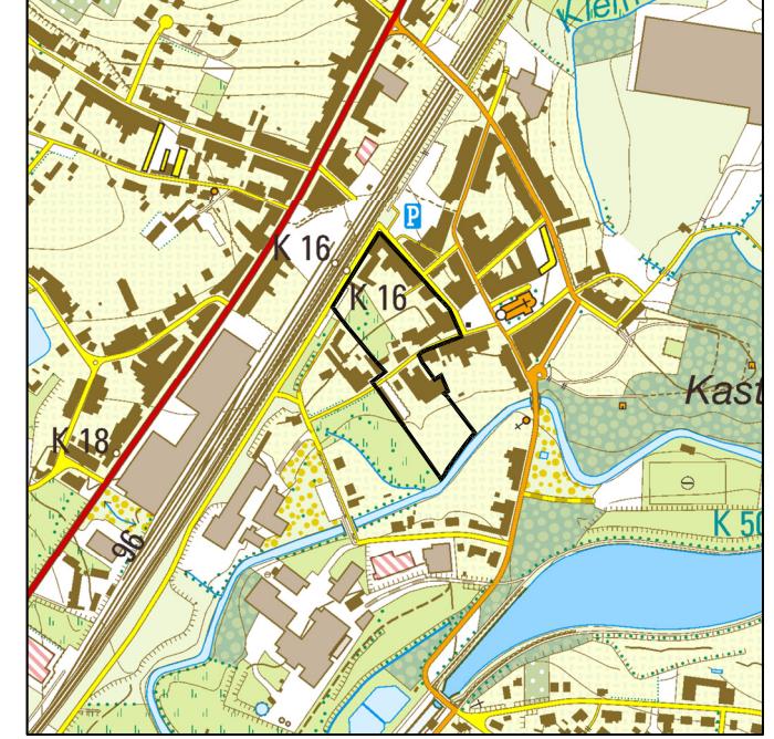
Uittreksel Topografische kaart - 1/10.000