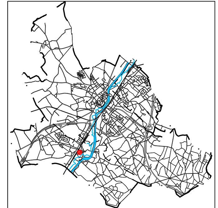
Situering binnen de stad

NOTA: Dit plan werd opgemaakt op basis van grafische gegevens. De erin vermelde afmetingen en oppervlakten zijn derhalve slechts benaderend. Voor de uitvoering van dit plan zijn opmetingen ter plaatse noodzakelijk.